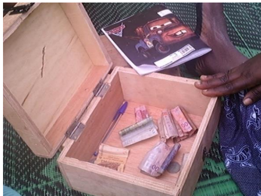
Rencontre des femmes autour du crédit solidaire à Mopti

C'est ainsi que les différents groupements ont pu mobiliser une épargne totale de 22 094 950 F CFA répartie comme suit :