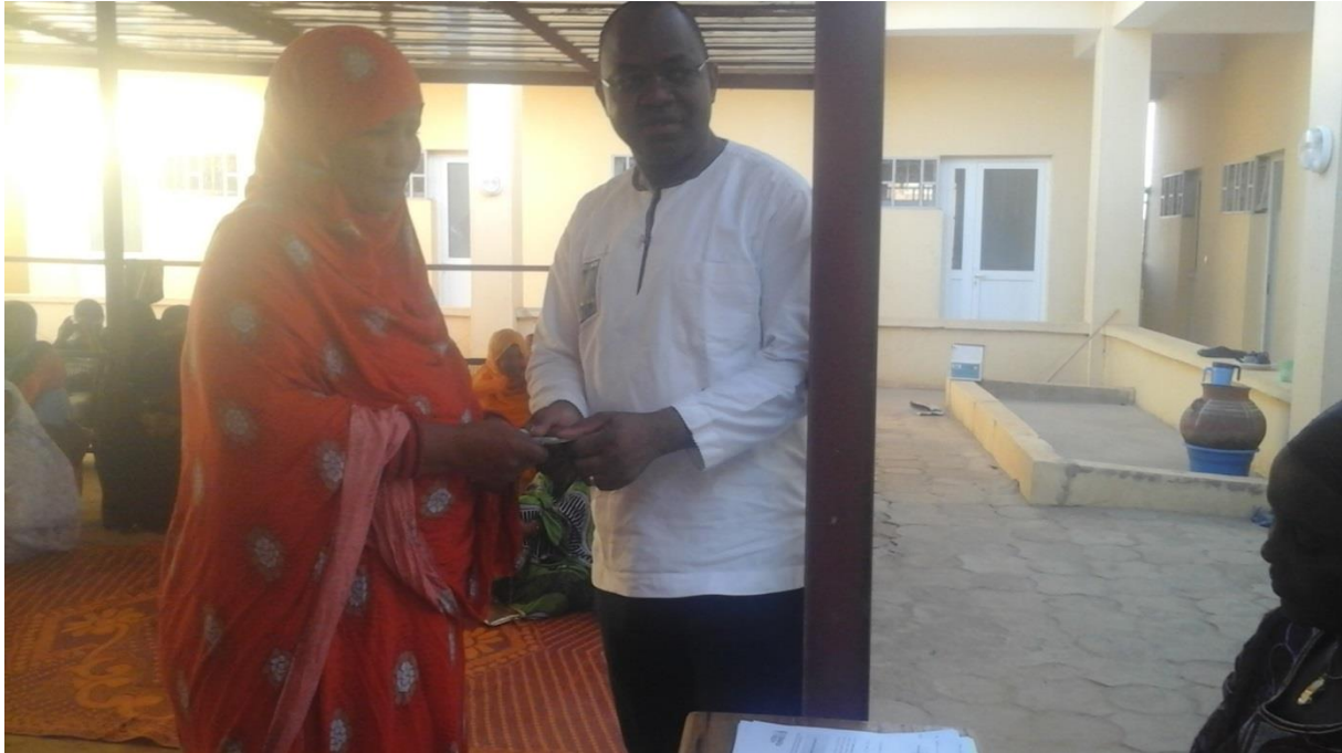
Remise à une bénéficiaire de Gao par le représentant ONU femmes

• Produit 2 : Les femmes affectées sont intégrées dans leurs milieux d'origine et sont mobilisées autour de la consolidation de la paix et la non-violence ;